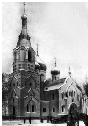
Церковь Покрова Пресвятой Богородицы На Громовском старообрядческом кладбище Построена в 1915 году Снесена в 1939 году

Концепция не была реализована из-за проблем с консолидацией земельных участков в руках города.